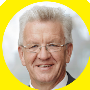
Winfried Kretschmann Ministerpräsident des Landes Baden-Württemberg

Dem Wettbewerb wünsche ich, dass er zahlreiche Teilnehmerinnen und Teilnehmer findet und dass von ihm nachhaltig wirkende Impulse gegen Fremdenfeindlichkeit und Rassismus und für Gleichberechtigung und Toleranz ausgehen.